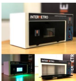
Figura 01 – À esquerda, diversas vistas do protótipo de gabinete de UV-C, e à direita, protótipo de irradiador (luminária) de UV-C.

O desenvolvimento de equipamentos e sistemas destinados à desinfecção por radiação ultravioleta germicida é o objeto de um projeto em curso, em parceria entre a ABENDI e a INTERMETRO, uma de suas empresas associadas. Hoje há três protótipos em vista (figura 01): o gabinete para desinfecção de pequenos objetos; o irradiador fixo, ou removível, para espaços pequenos e médios; e a torre móvel robotizada, para desinfecção de ambientes.